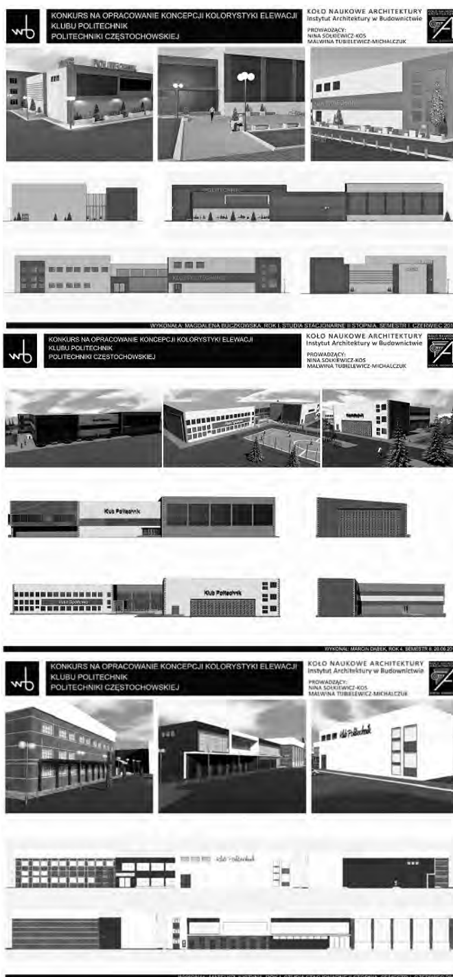
Rys. 2. Koncepty projektowe modernizacji elewacji - prace wykonane pod opieką merytoryczną nauczycieli akademickich: Niny Sołkiewicz-Kos, Malwiny Tubielewicz-Michalczuk