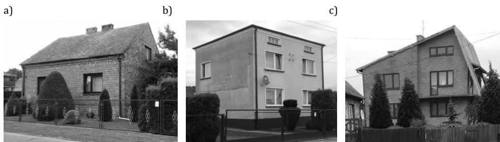
Rys. 1. Typowe budynki jednorodzinne wzniesione: a) przed 1970 r.; b) w latach 1970–82; c) w latach 1983–95

W latach 80. nastąpiły kolejne zmiany cech budynków na analizowanym terenie. Przede wszystkim na poziomie przyziemia umieszczano coraz częściej pomieszczenia mieszkalne – realizowano zarówno budynki parterowe (w większości z poddaszem użytkowym) lub piętrowe (w większości z poddaszem nieużytkowym). Charakterystyczne dla tego okresu jest stosowane w niektórych budynkach asymetryczne nachylenie połaci dachowych (rys. 1c). Pokrycie dachowe wykonywano najczęściej z blachy płaskiej, blachy fałdowej lub eternitu. W tym okresie upowszechniły się mury szczelinowe ze szczeliną wypełnioną warstwą styropianu o grubości 5 cm. Warstwę nośną wykonywano najczęściej z pustaka MAX i pustaka żużłobetonowego, rzadziej z silikatu lub gazobetonu, natomiast warstwę elewacyjną z cegły lub połówek pustaków.