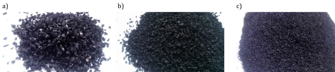
Rys. 1. Materiał pochodzący z recyklingu opon samochodowych: a) granulaty gumowy o frakcji 4–6 mm; b) granulaty gumowy o frakcji 2–4 mm; c) miął o frakcji poniżej 1 mm

Granulaty gumowy dzieli się na: strzępy (40–300 mm), chipsy (10–40 mm), granulaty (1–10 mm), miął (poniżej 1 mm), pył (poniżej 0,5 mm), ścier (0–40 mm).